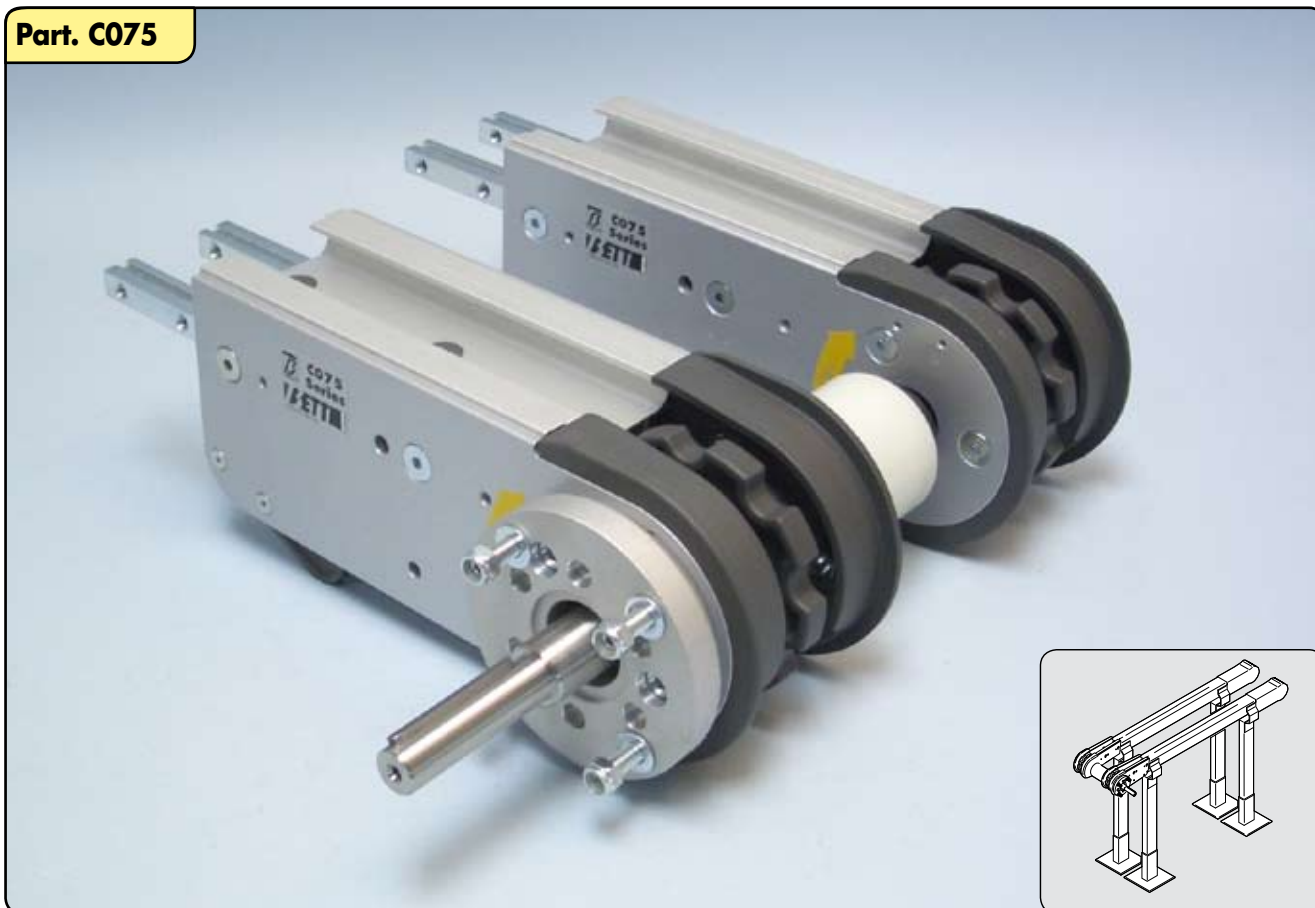
Gruppo DOPPIO traino di testa diretto per riduttore VF44/F